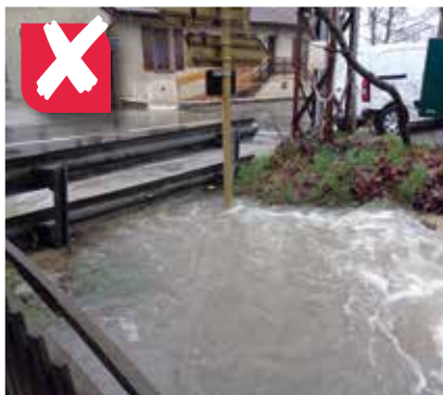
NON , c'est au propriétaire de la route d'agrandir le gabarit du pont