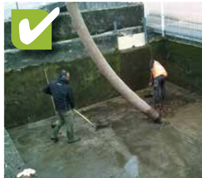
OUI , c'est au CISALB de curer les ouvrages dont il a la gestion (ici le bassin de Boncelin à Aix-les-Bains)