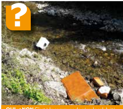
OUI et NON C'est à la commune de gérer la salubrité publique, sauf si les déchets ont une taille jugée dangereuse pour l'écoulement des crues