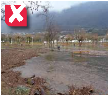
NON , c'est au propriétaire du camping de nettoyer les bois déposés par la crue du lac