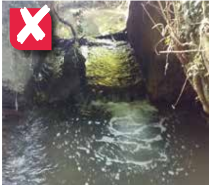
NON , c'est au propriétaire de ce passage agricole de refaire le pont qui s'est écroulé