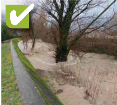
OUI , car si cet arbre tombe dans la rivière en crue, il y a risque d'inondation de personnes et de biens