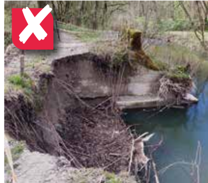
NON , c'est au propriétaire de payer la remise en état de son sentier détruit par l'érosion de la rivière